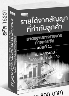
รหัส 16201 (ราคา 800 บาท) สมาชิก 720.- ค่าส่ง 60.-