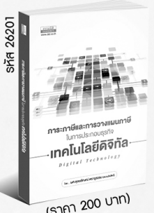
รหัส 26201 (ราคา 200 บาท) สมาชิก 180.- ค่าส่ง 30.-