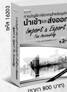
รหัส 16203 (ราคา 800 บาท) สมาชิก 720.- ค่าส่ง 60.-