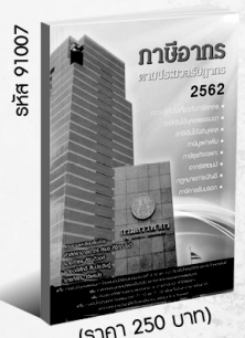
รหัส 91007 (ราคา 250 บาท) สมาชิก 225.- ค่าส่ง 40.-