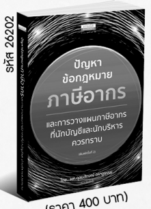
รหัส 26202 (ราคา 400 บาท) สมาชิก 360.- ค่าส่ง 40.-