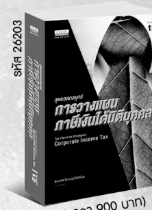
รหัส 26203 (ราคา 900 บาท) สมาชิก 810.- ค่าส่ง 80.-