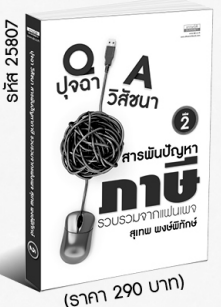
รหัส 25807 (ราคา 290 บาท) สมาชิก 260.- ค่าส่ง 40.-