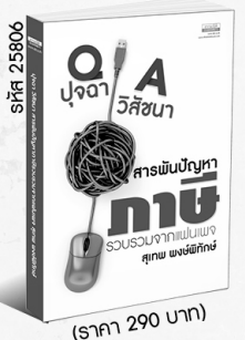
รหัส 25806 (ราคา 290 บาท) สมาชิก 260.- ค่าส่ง 40.-