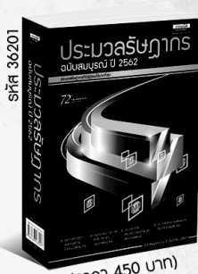
รหัส 36201 (ราคา 450 บาท) สมาชิก 400.- ค่าส่ง 50.-