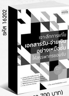
รหัส 16202 (ราคา 700 บาท) สมาชิก 630.- ค่าส่ง 60.-